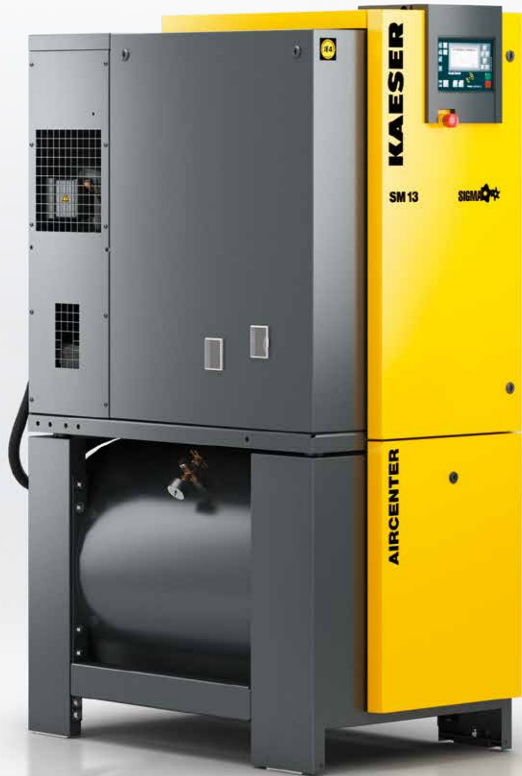
Imagen: AIRCENTER 13