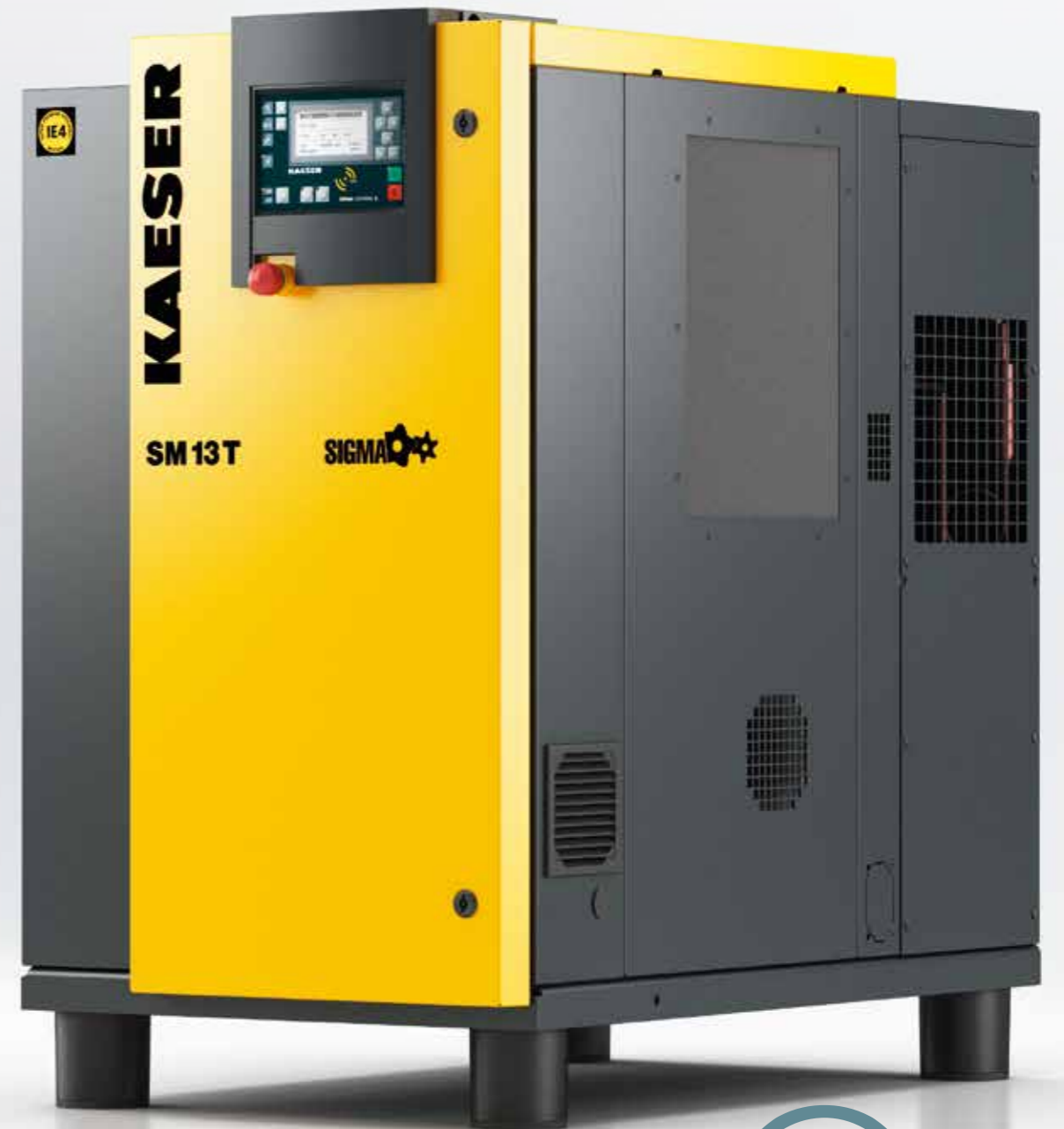
Imagen: SM 13 T

Todos los trabajos de mantenimiento pueden llevarse a cabo desde el mismo lateral. Para ello, el panel izquierdo de la carcasa es desmontable, y desde allí es sencillo acceder a todos los puntos de mantenimiento.