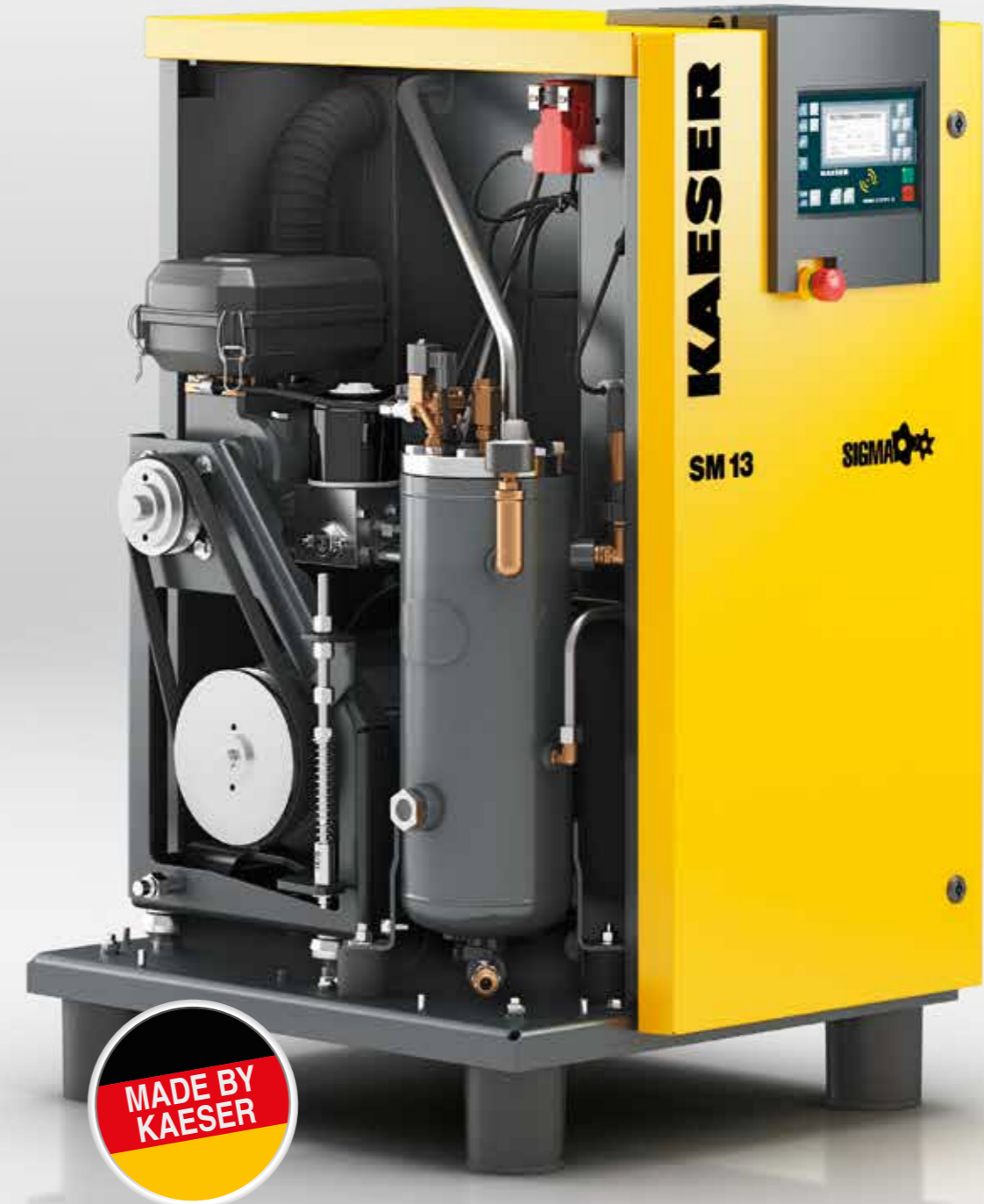
Imagen: SM 13

Hasta 96% aprovechable en forma de calor