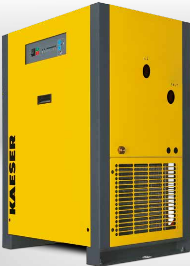
Versión básica THP 40-50